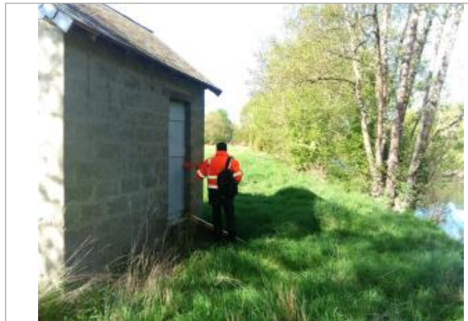
Vue du site en 2024, avec le repère de la crue de fin mars 2024

Coordonnées WGS84 : X: 1.07442400 / Y: 47.19514600