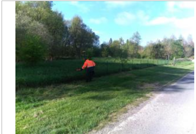
Vue du site en 2024, avec le repère de la crue de fin mars 2024

Coordonnées WGS84 : X: 1.02033000 / Y: 47.20139300