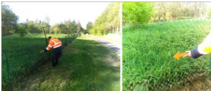
Vue du repère en 2024