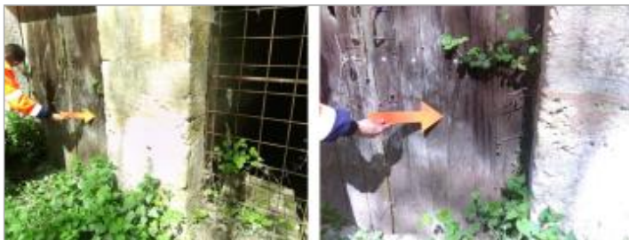
Vue du repère en 2024