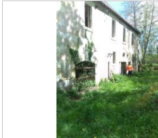
Vue du site en 2024, avec le repère de la crue de fin mars 2024

Coordonnées WGS84 : X: 1.14708000 / Y: 47.15894400