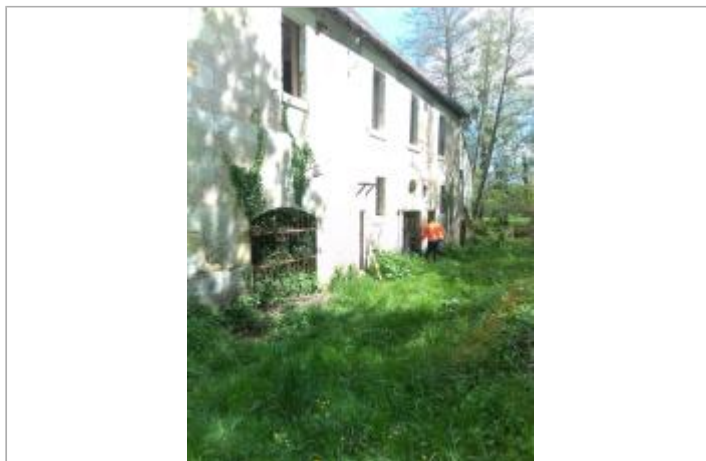
Vue du site en 2024, avec le repère de la crue de fin mars 2024