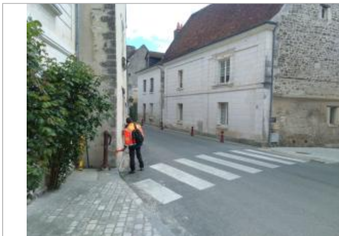
Vue du site en 2024, avec le repère de la crue de fin mars 2024