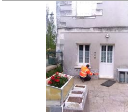
Vue du site en 2024, avec le repère de la crue de fin mars 2024

Coordonnées WGS84 : X: 1.22073100 / Y: 47.09289600