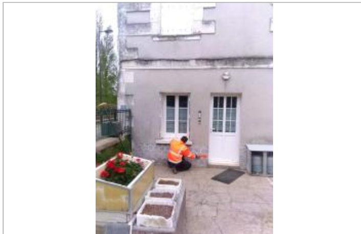
Vue du site en 2024, avec le repère de la crue de fin mars 2024