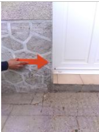
Vue du repère en 2024

Altitude calculée de l'eau (en m) : 104.659 m