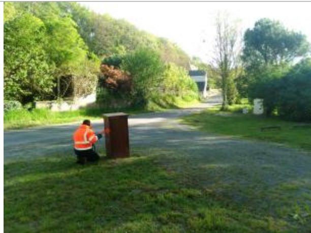
Vue du site en 2024, avec le repère de la crue de fin mars 2024