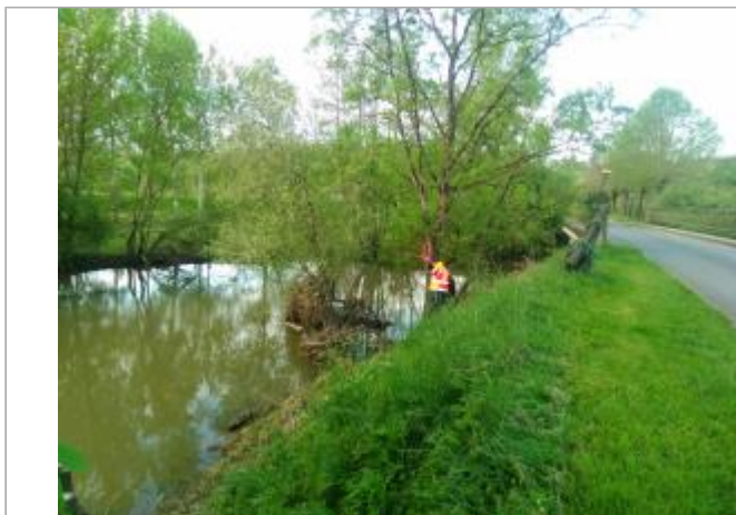
Vue du site en 2024, avec le repère de la crue de fin mars 2024

Coordonnées WGS84 : X: 0.94845200 / Y: 47.21057700