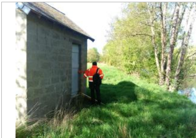
Vue du site en 2024, avec le repère de la crue de fin mars 2024