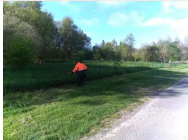
Vue du site en 2024, avec le repère de la crue de fin mars 2024