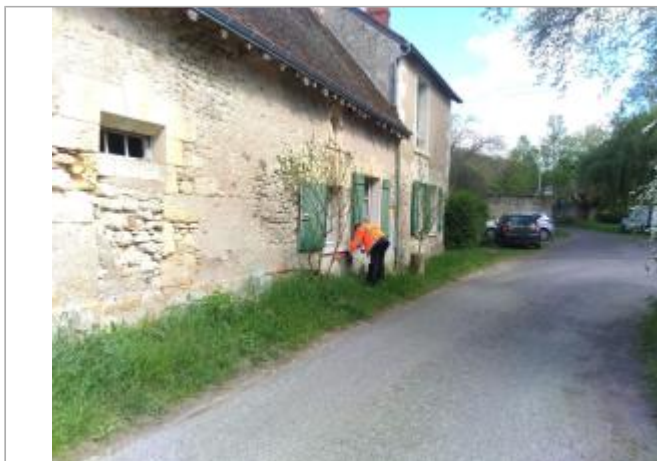
Vue du site en 2024, avec le repère de la crue de fin mars 2024