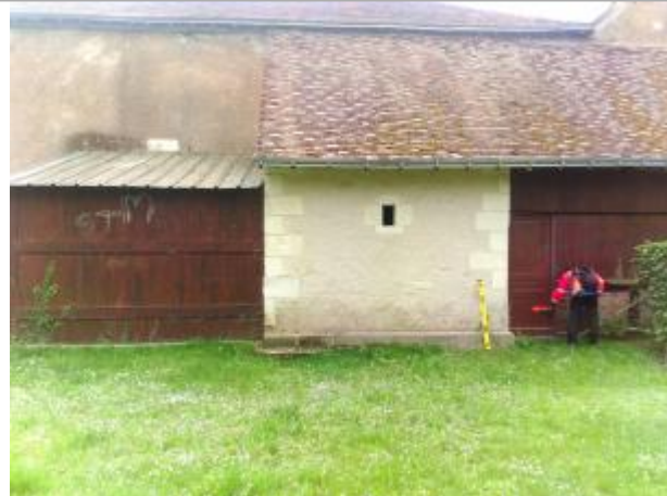
Vue du site en 2024, avec le repère de la crue de fin mars 2024