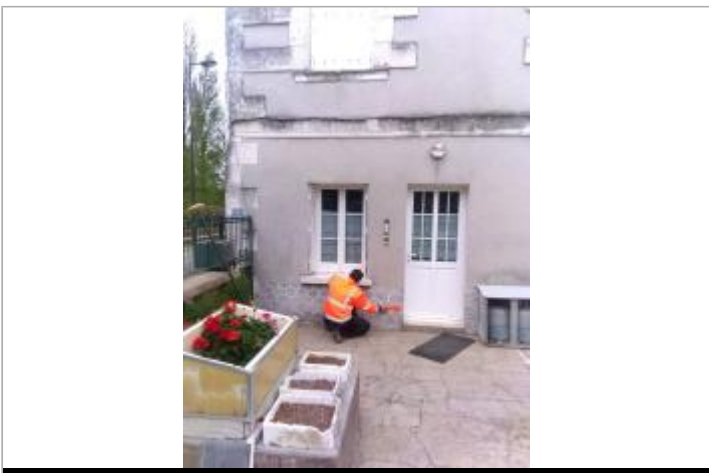
Vue du site en 2024, avec le repère de la crue de fin mars 2024

GÉOLOCALISATION Coordonnées WGS84 : X: 1.22073100 / Y: 47.09289600 Coordonnées RGF93 (Lambert 93) X: 565043.5 / Y: 6667369.47 Coordonnées RGF93 (ETRS89) : X: 1.220731 / Y: 47.092896 Code Hydro: K74-0300 Rive de référence: Droite