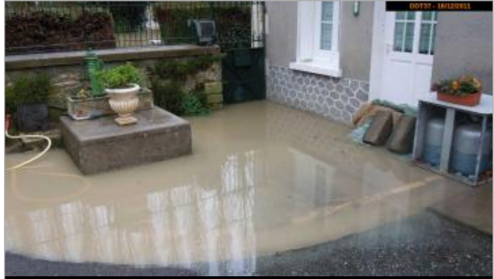
Photographie pendant l'inondation

MARQUE Maximum de l'inondation : Non renseigné Visibilité : Oui État du repère : Non renseigné