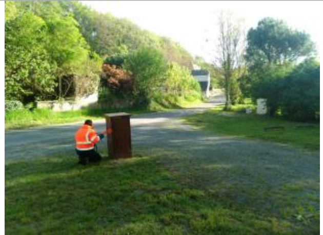
Vue du site en 2024, avec le repère de la crue de fin mars 2024

Coordonnées WGS84 : X: 1.02123300 / Y: 47.20163800