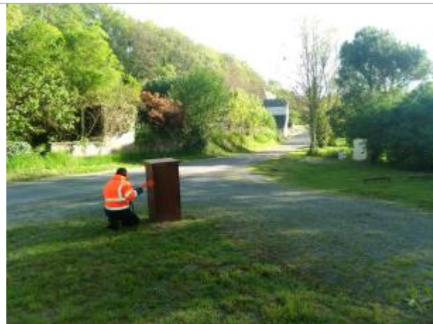
Vue du site en 2024, avec le repère de la crue de fin mars 2024