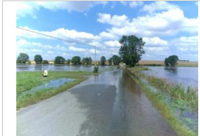
Vue du site, le 24/06/2024, SPC LACI

Coordonnées WGS84 : X: 2.06702200 / Y: 47.02807900