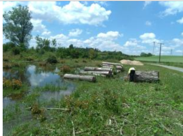
Vue du site, le 24/06/2024, SPC LACI

Coordonnées WGS84 : X: 2.11956100 / Y: 46.99990200