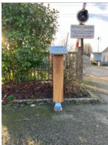
Repère fixé au pied du panneau d'information