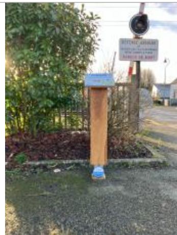
Vue du panneau d'information et du repère de crues

Coordonnées RGF93 (ETRS89) : X: -0.8856748 / Y: 48.0968448