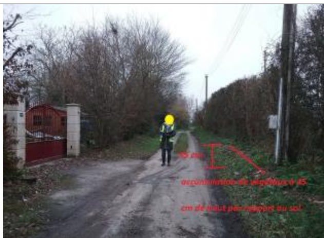
localisation du repe sur la pente du talus.

NIVELLEMENT SPC SACN. LE SPC N'EST PAS GÉOMÈTRE EXPERT, LES COTES SONT DONNÉES À TITRE INDICATIF. - 23/05/2025