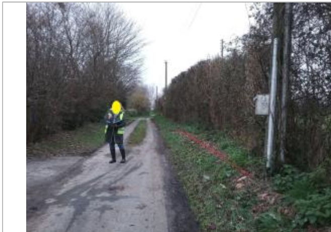
talus en rive droit du chemin du pont du tonnerre, face au n°139 et à 2m après le poteau électrique

Coordonnées WGS84 : X: -0.01887205 / Y: 49.16230630