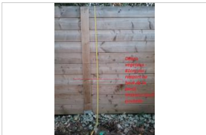
débris de végétaux sur la paroi en bois au fond du local poubelle du chemin du pont du tonnerre.