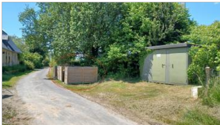
Vue depuis le chemin du Pont du Tonnerre.