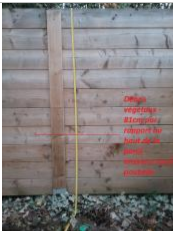
débris de végétaux sur la paroi en bois au fond du local poubelle du chemin du pont du tonnerre.

NIVELLEMENT SPC SACN. LE SPC N'EST PAS GÉOMÈTRE EXPERT, LES COTES SONT DONNÉES À TITRE INDICATIF. - 23/05/2025