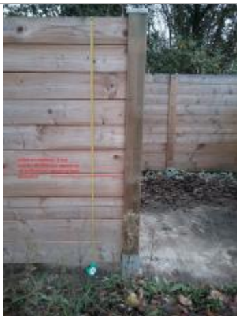
débris de végétaux sur la paroi en bois du local poubelle, à gauche de l'accès à la zone de stockage des déchets jaunes