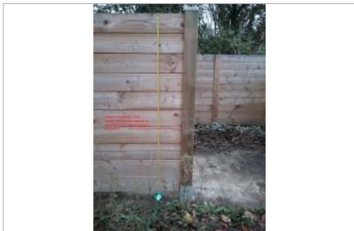
débris de végétaux sur la paroi en bois du local poubelle, à gauche de l'accès à la zone de stockage des déchets jaunes