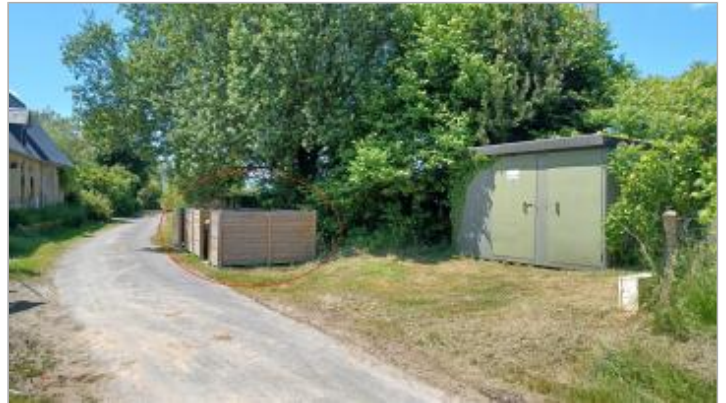
Vue depuis le chemin du Pont du Tonnerre.

Coordonnées WGS84 : X: -0.01846773 / Y: 49.16244710