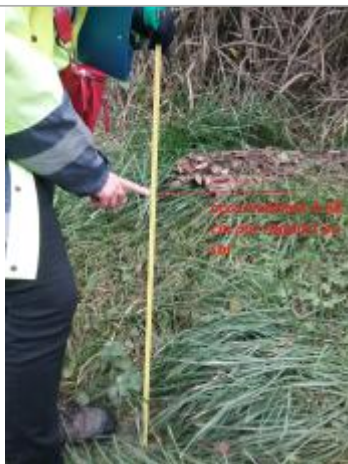
accumulation de végétaux en sommet de talus en rive droite