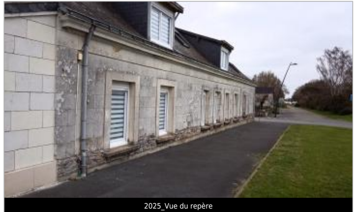
2025_Vue du repère