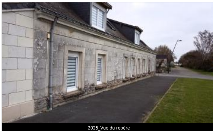
2025_Vue du repère

GÉOLOCALISATION Coordonnées WGS84 : X: -0.26283920 / Y: 47.45166130 Coordonnées RGF93 (Lambert 93) X: 454211.33 / Y: 6710779.6 Coordonnées RGF93 (ETRS89) : X: -0.2628392 / Y: 47.4516613 Code Hydro: L92-0300 Rive de référence: Droite