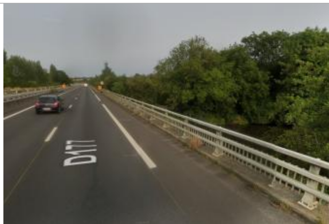
Sous le pont de la RD 177 rive droite à Goven

Coordonnées WGS84 : X: -1.77382933 / Y: 48.02584320