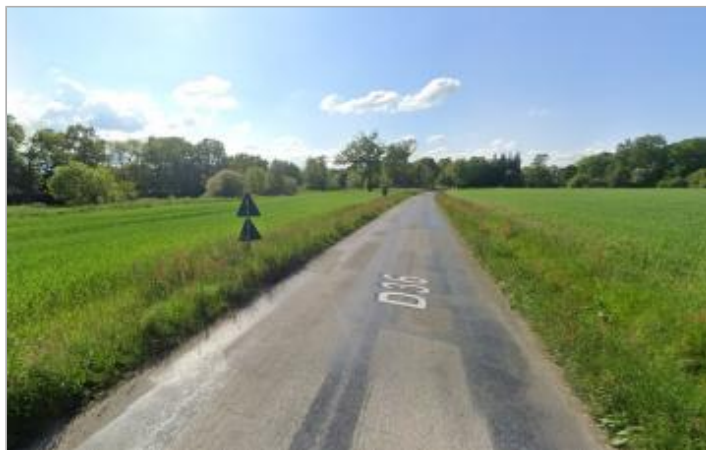
Chaussée de la RD 36 entre les deux bras de Vilaine