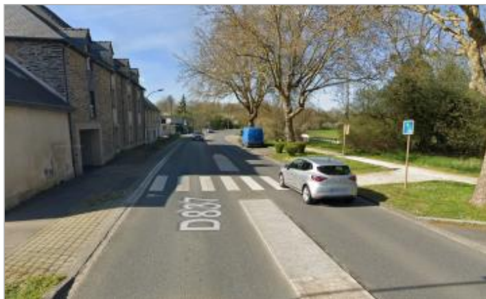
Chaussée de la RD 837 dans Pont-Péan