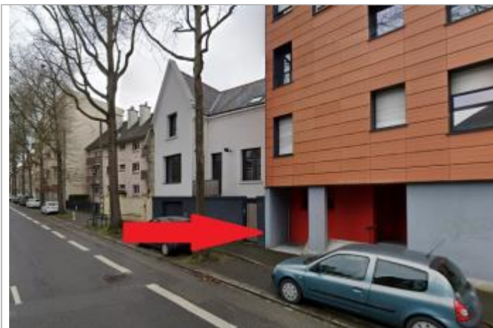
Angle de la maison au n°8 avec le n°10 avenue Gros Malhon