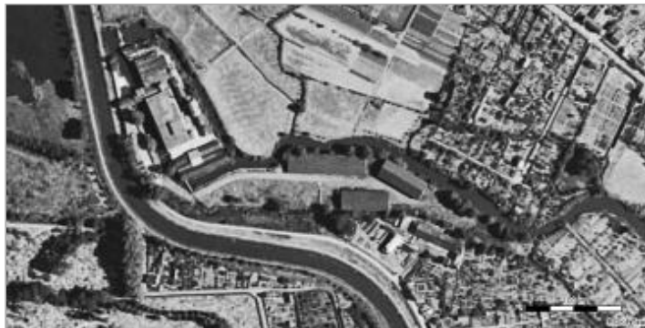
du site en 1965