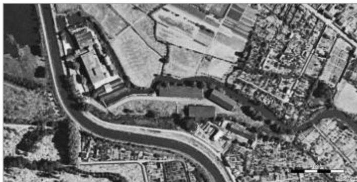
Photo de l'IGN du site en 1965