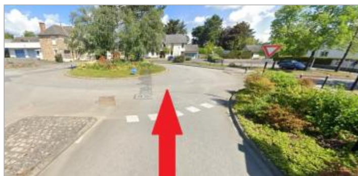
Rond point des rues Judith d'Acigné (RD100) et des Vignerons (ex-VC9)

GÉOLOCALISATION Coordonnées WGS84 : X: -1.53333808 / Y: 48.13441930 Coordonnées RGF93 (Lambert 93) X: 362948.33 / Y: 6791239.24 Coordonnées RGF93 (ETRS89) : X: -1.5333381 / Y: 48.1344193 Code Hydro: J---0060 Rive de référence: Droite