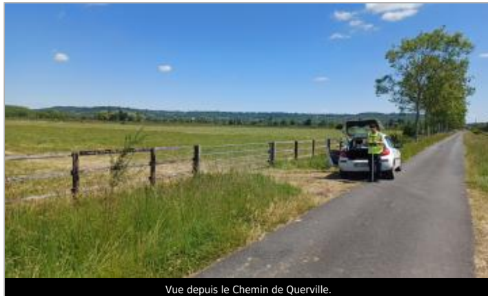
Vue depuis le Chemin de Querville.

Coordonnées WGS84 : X: -0.02577540 / Y: 49.12505560