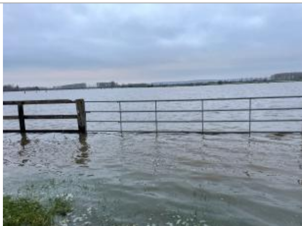
Chemlin_Querville_Barrière_Champ_49°07'30.2 N 0°01'32.8 W_inondee