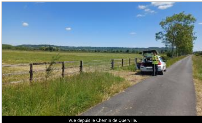
Vue depuis le Chemin de Querville.