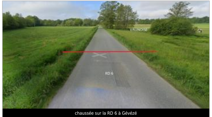
chaussée sur la RD 6 à Gévézé

Coordonnées WGS84 : X: -1.85611992 / Y: 48.14672520