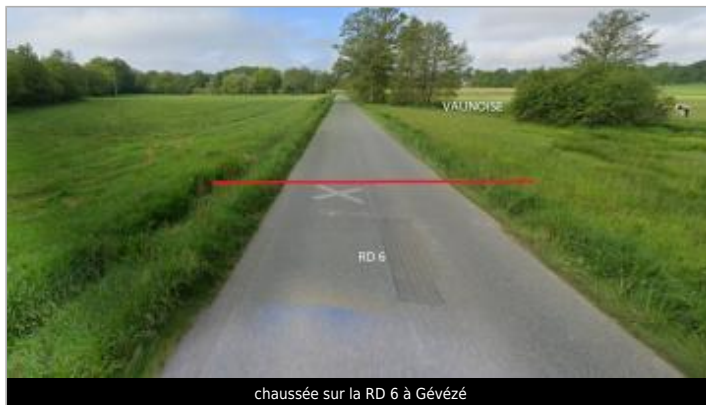
chaussée sur la RD 6 à Gévézé

Coordonnées WGS84 : X: -1.85611992 / Y: 48.14672520