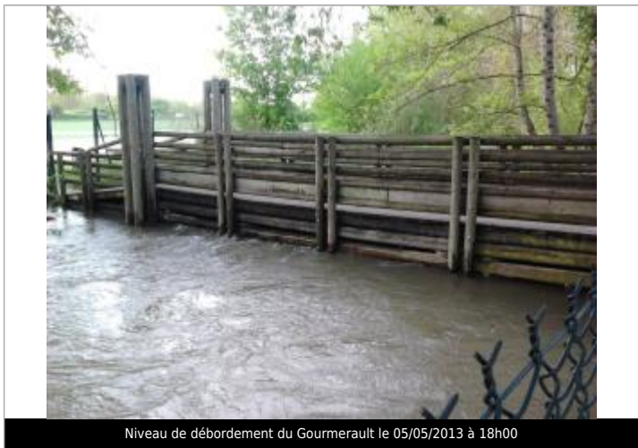
Niveau de débordement du Gourmerault le 05/05/2013 à 18h00