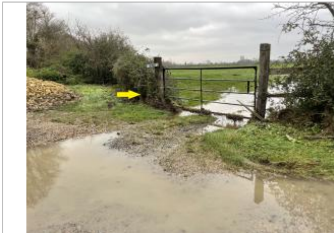
Chemin_Canes à jour_1er_poteau_cloture_barbelés à gauche_Barrière_Champ_57002_après_ferme_DDTM14