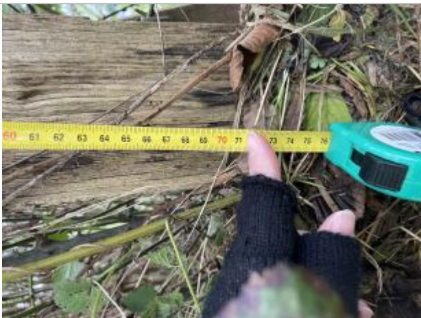
Amas_Végétaux situé bas_1er_poteau Cloture_Barbelé_71cm_mesure_depuis_haut_poteau

NIVELLEMENT SPC SACN. LE SPC N'EST PAS GÉOMÈTRE EXPERT, LES COTES SONT DONNÉES À TITRE INDICATIF. - 23/05/2025