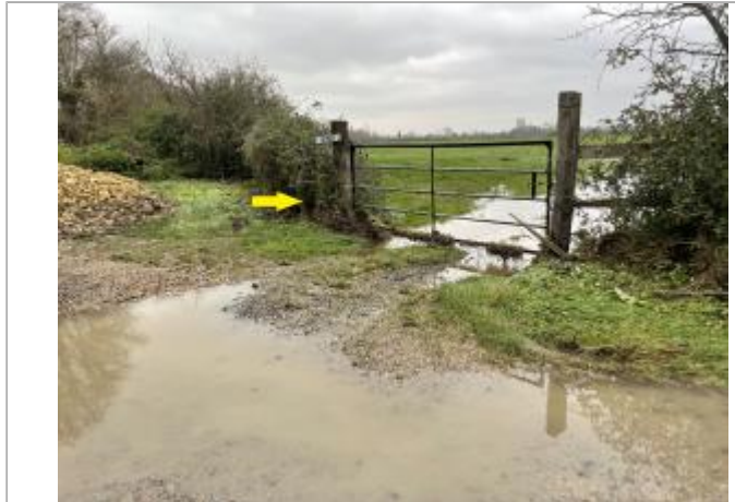
Chemin_Canes à Jour_1er_poteau_cloture_barbelés à gauche_Barrière_Champ_57002_après_ferme_DDTM14

Coordonnées WGS84 : X: -0.02043240 / Y: 49.11334400