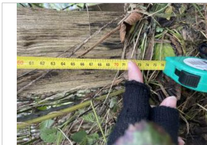
Amas_Végétaux situé bas_1er_poteau Cloture_Barbelé_71cm_mesure_depuis_haut_poteau