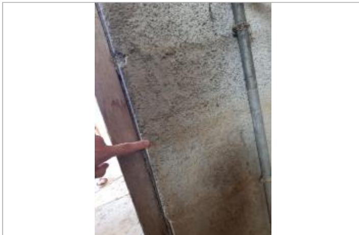
dans le lavoir fermé à clé