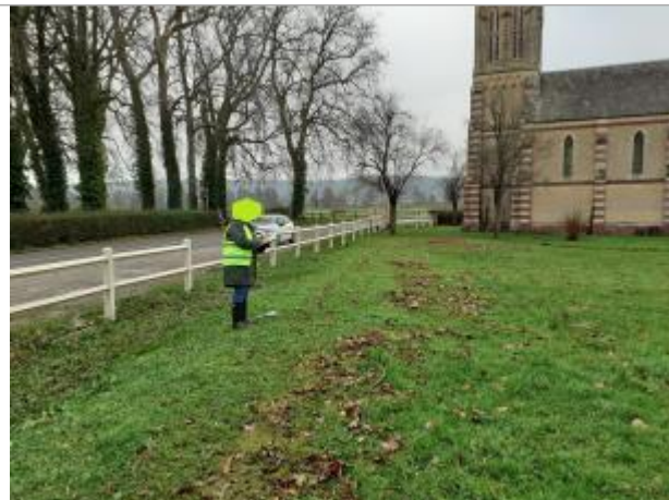
Parcelle autour de l'Eglise de Victot-Pontfol, en bordure de la RD49, route de Cabourg