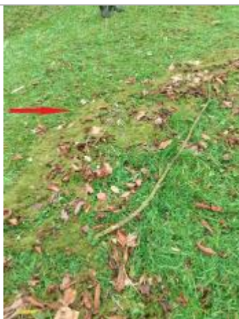
Accumulation de lentille verte sur le sol de la pelouse de l'Eglise

NIVELLEMENT SPC SACN. LE SPC N'EST PAS GÉOMÈTRE EXPERT, LES COTES SONT DONNÉES À TITRE INDICATIF. - 23/05/2025