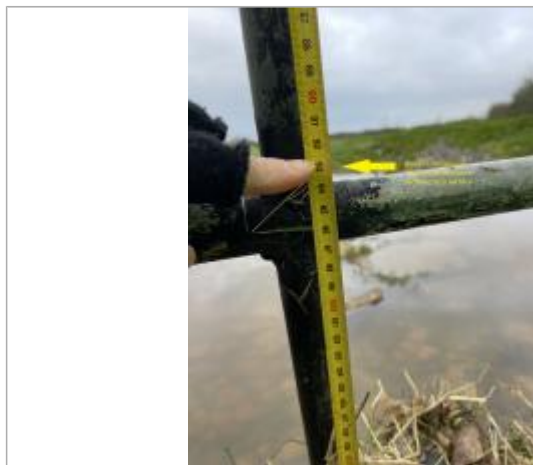
Amas_Herbe_Barriere_Champ_n°527002_93cm_mesure prise en partant barre du haut milieu barriere