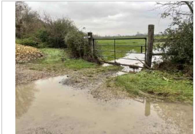
Chemin_Canes_Jour_Barriere_Champ_57002_après_100m après ferme_DDTM 14

Coordonnées WGS84 : X: -0.02043240 / Y: 49.11334400