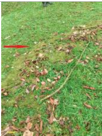
Accumulation de lentille verte sur le sol de la pelouse de l'Eglise

NIVELLEMENT SPC SACN. LE SPC N'EST PAS GÉOMÈTRE EXPERT, LES COTES SONT DONNÉES À TITRE INDICATIF. - 23/05/2025