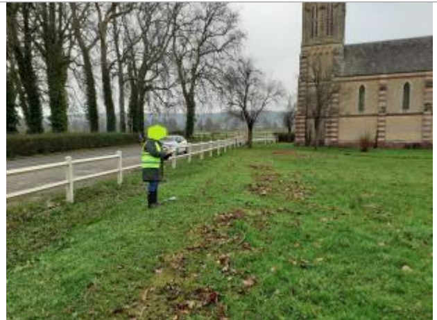
Parcelle autour de l'Eglise de Victot-Pontfol, en bordure de la RD49, route de Cabourg

Coordonnées WGS84 : X: -0.01846011 / Y: 49.16536820