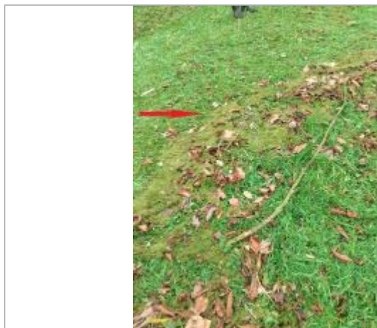
Accumulation de lentille verte sur le sol de la pelouse de l'Eglise

NIVELLEMENT SPC SACN. LE SPC N'EST PAS GÉOMÈTRE EXPERT, LES COTES SONT DONNÉES À TITRE INDICATIF. - 23/05/2025