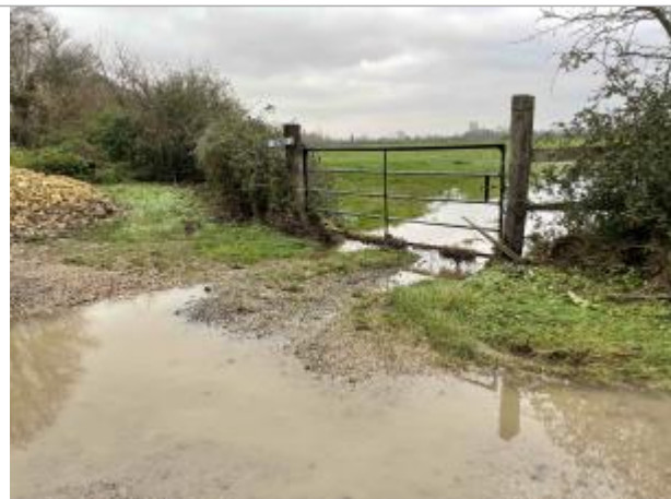
Chemin_Canes_Jour_Barriere_Champ_57002_après_100m après ferme_DDTM 14