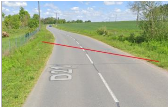
RD 21 à L'Hermitage lieu-dit Frétille

Coordonnées WGS84 : X: -1.82633795 / Y: 48.13195130