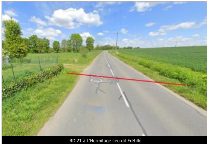
RD 21 à L'Hermitage lieu-dit Frétille

Coordonnées WGS84 : X: -1.82615850 / Y: 48.13253380