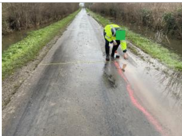
Mesure marque peinte depuis autre côté de la chaussée

NIVELLEMENT SPC SACN. LE SPC N'EST PAS GÉOMÈTRE EXPERT, LES COTES SONT DONNÉES À TITRE INDICATIF. - 23/05/2025