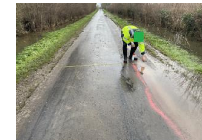
Mesure marque peinte depuis autre côté de la chaussée