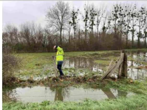
1er poteau à gauche de la barrière

Coordonnées WGS84 : X: -0.02771860 / Y: 49.11284690