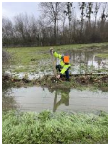
Mesure depuis haut poteau

NIVELLEMENT SPC SACN. LE SPC N'EST PAS GÉOMÈTRE EXPERT, LES COTES SONT DONNÉES À TITRE INDICATIF. - 23/05/2025