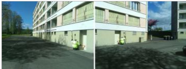
Vues du site en 2024 avec le repère de la crue d'avril 2024