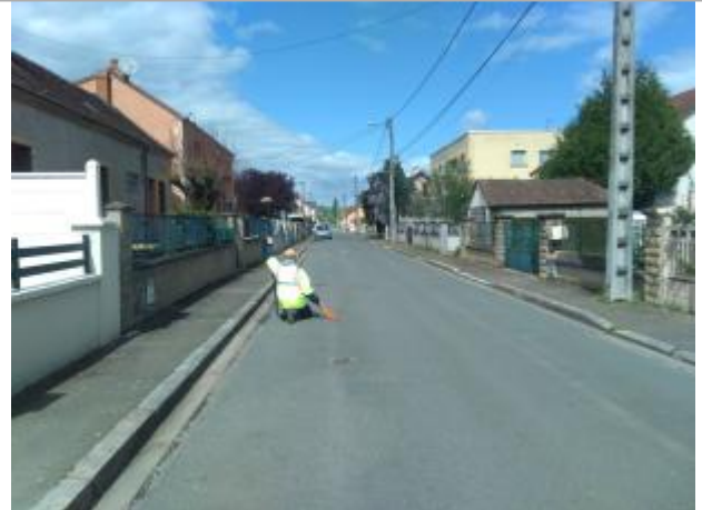
Vue du site en 2024 avec le repère de la crue d'avril 2024