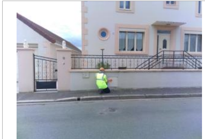
Vue du site en 2024 avec le repère de la crue d'avril 2024