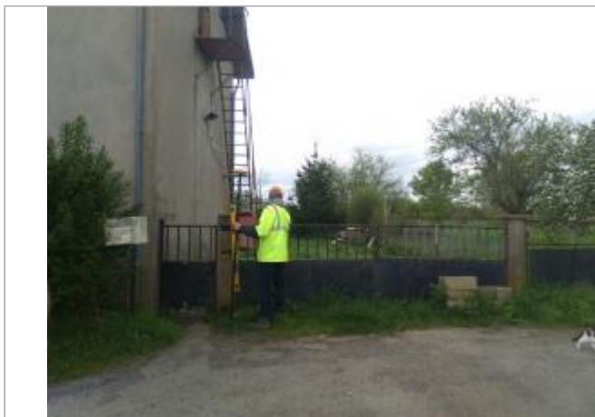
Vue du site en 2024 avec le repère de la crue d'avril 2024