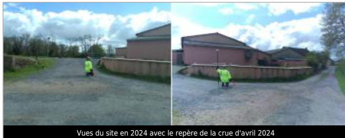
Vues du site en 2024 avec le repère de la crue d'avril 2024

Coordonnées WGS84 : X: 4.00544168 / Y: 46.49624620