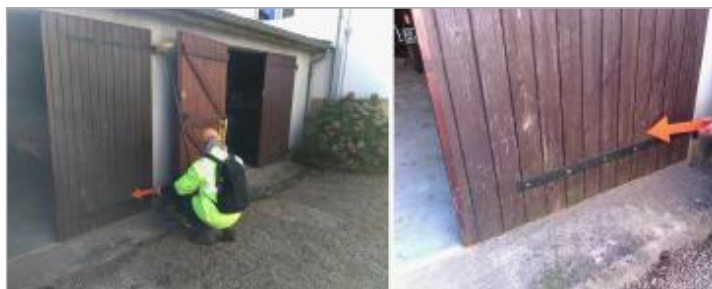
Vues du repère en 2024